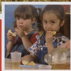
Pasticceria Via le merendine dalle scuole inferiori