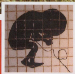
Pane L'uomo di pane

Edizione DTPubblipeppio srl Via del Forno alle Arenate, 1/4 - 00163 Roma - Ponte Politeo S. - Speciazione in abbonamento per il numero 382/2005 (Conv. in L.27/02/2004 n. 46) Art. 1, comma 1, DCB Roma In caso di mancato receipto inviare al CNP. Regolamento per la ristampa di materiale: previo pagamento, resti